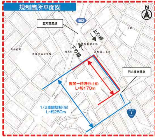
(国土地理院標準地図に地名、範囲を加工掲載)