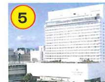
ホテルグランヴィア広島