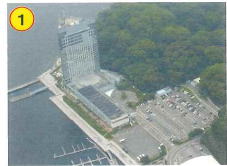
グランドプリンスホテル広島