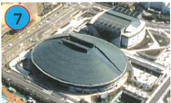
広島県立総合体育館