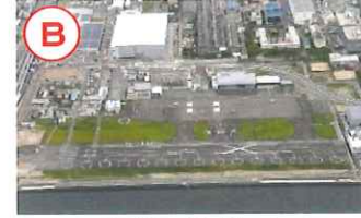
広島ヘリポート (広島市)