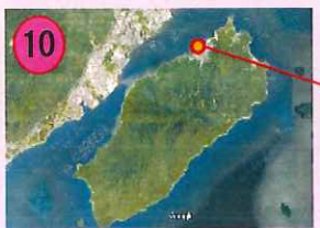
宮島(右写真は厳島神社)