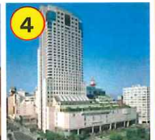
リーガロイヤル ホテル広島