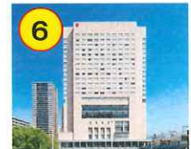
シェラトングランドホテル広島