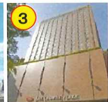
ANAクラウン プラザホテル広島