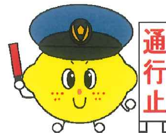
G7広島サミット交通規制キャラクター ひかえるモン