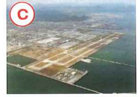
在日米軍岩国飛行場 (山口県岩国市)