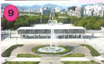
広島平和記念公園