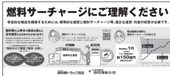
「燃料サーチャージ」