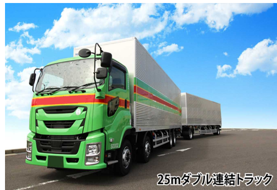
25mダブル連結トラック

東北自動車道(北上江釣子ICまで) ～ 圏央道 ～ 東名高速道路 ～ 名神高速道路・新名神高速道路 ～ 山陽自動車道 ～ 九州自動車道(太宰府ICまで)