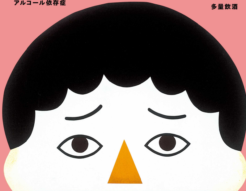
Illustration: tupera tupera